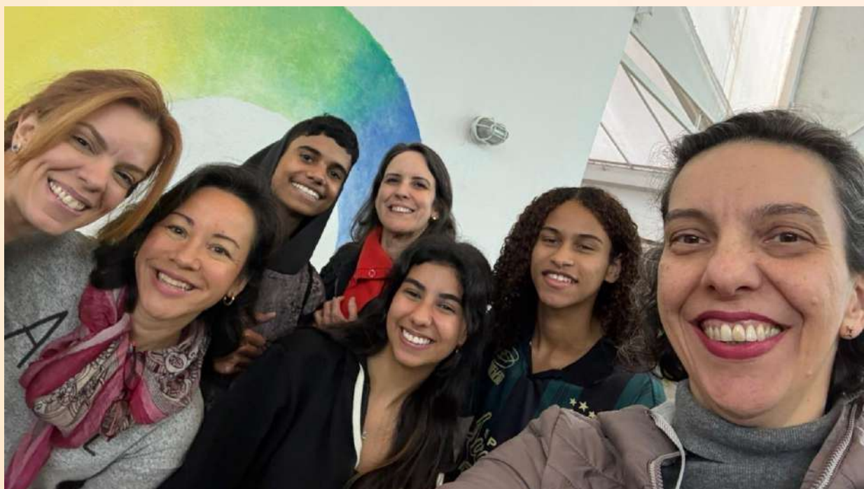
Encontro no 1º semestre

Também nos reunimos com as famílias das Flechas do Ensino Fundamental e Educação Infantil, em uma primeira iniciativa para nos aproximarmos, uma vez que esses alunos ainda são mais dependentes dos adultos. O encontro on-line foi realizado em dezembro.